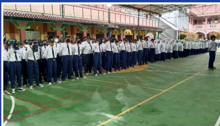
LAPANGAN UPACARA SMP AL AMANAH