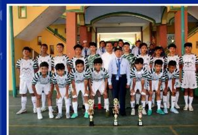
KEGIATAN EKSKUL FUTSAL