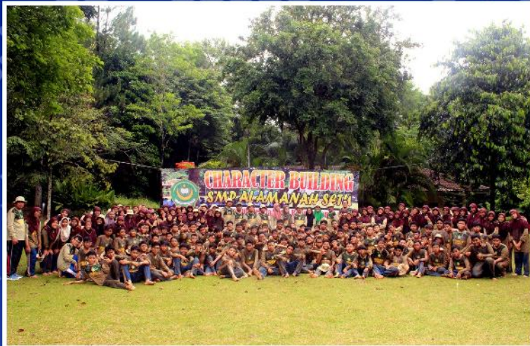
KEGIATAN CHARACTER BUILDING

Menyiapkan siswa yang memiliki keunggulan dalam Akademik maupun Non Akademik.