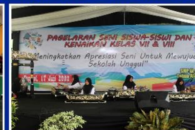
KEGIATAN SENI KARAWITAN