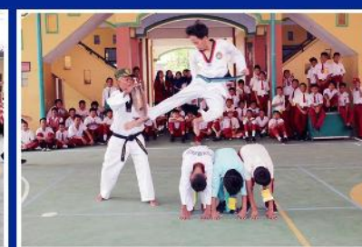
KEGIATAN EKSKUL TAEKWONDO