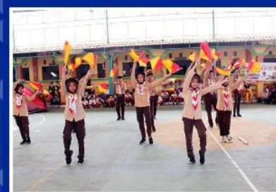
KEGIATAN EKSKUL PRAMUKA